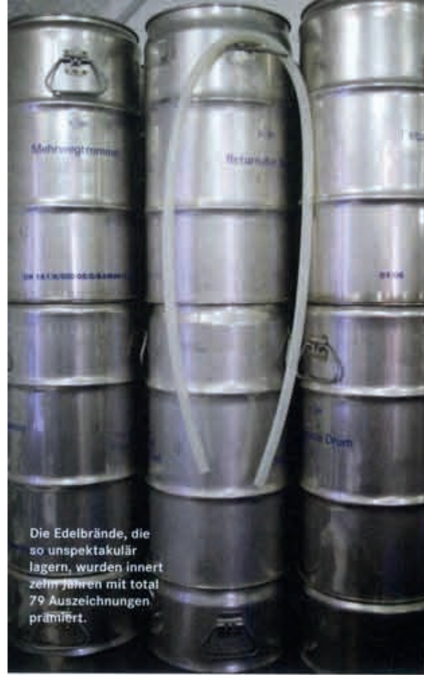
Die Edelbrände, die so unspektakulär lagern, wurden innert zwennein mit total 79 Auszeichnungen prämiert.