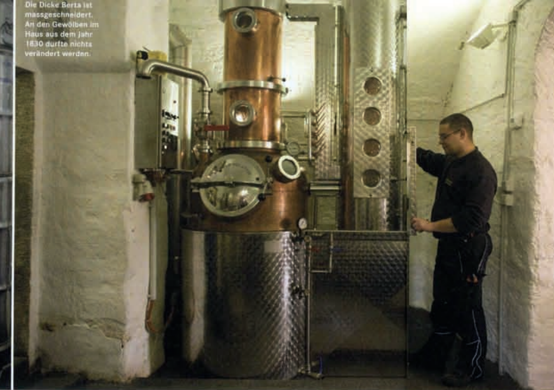
Die Dicke Berta ist massgeschneidert. An den Gewölben im Haus aus dem Jahr 1810 durfte nichts verändert werden.

Woher haben Sie das ganze Wissen? | Lesen statt fernsehen. Ich habe unglaublich viel gelesen.